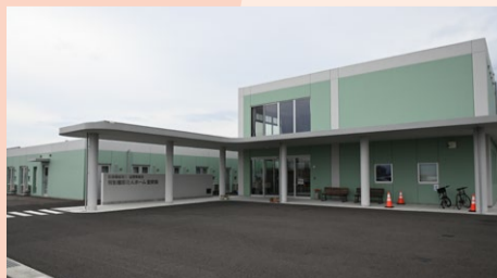
社会福祉法人聖愛育成会 特別養護老人ホーム聖愛園